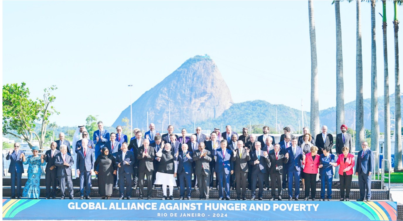
当地时间11月18日上午，国家主席习近平在巴西里约热内卢出席二十国集团领导人第十九次峰会。峰会把“构建公正的世界和可持续的星球”作为主题，并决定成立“抗击饥饿与贫困全球联盟”。这是习近平与会领导人共同参加巴方发起的“抗击饥饿与贫困全球联盟”合影。

新华社里约热内卢11月18日电（记者倪四义 姜岩）当地时间11月18日上午，国家主席习近平在巴西里约热内卢出席二十国集团领导人第十九次峰会。